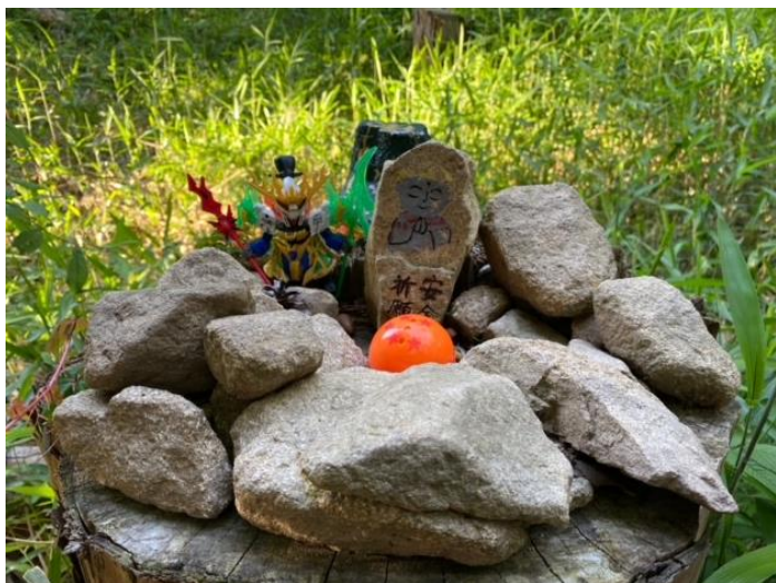
下山中にこんなかわいい物発見！ 登山者の安全を願ってくれています♪