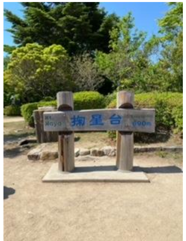
お昼休憩所の南星台(0° v°)ノ