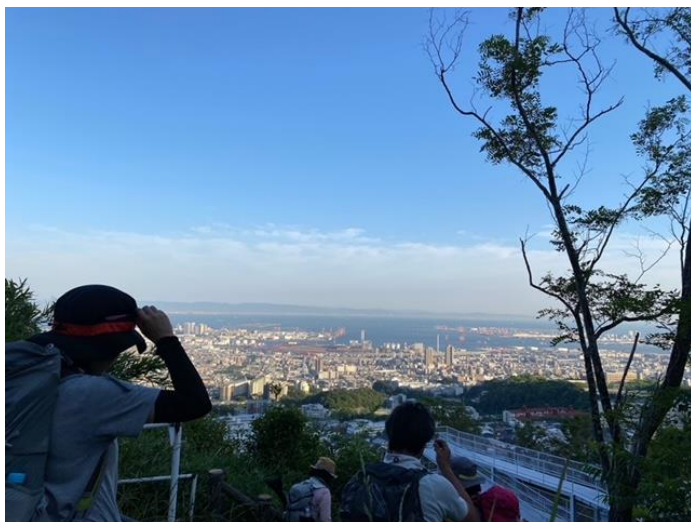
「ステキ～☆」ときれいな景色に思わず声が出ます♪