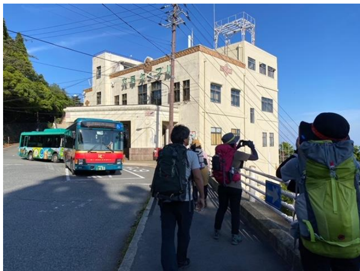
ゴールが近づいてきました!(^^)!