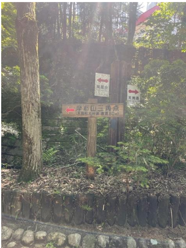
摩耶山三角点到着 ☺^0^