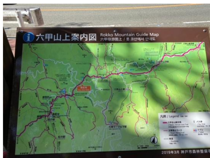
15:30 まだまだ歩きます 🚶