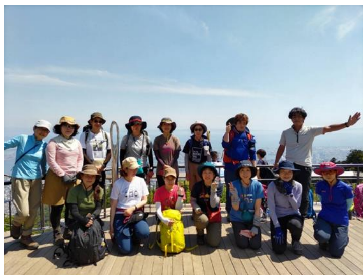
最高の天気 ☀️ 皆でパシャリ 📷