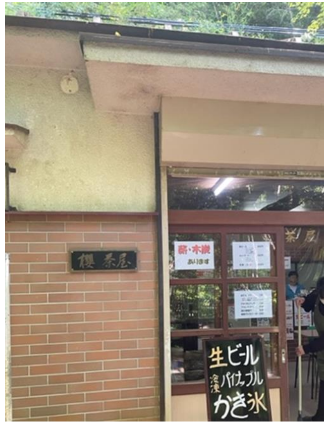
市ヶ原の休憩所櫻茶屋 ☺