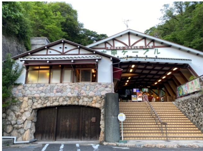
お疲れさまでした～ 無事、全員で下山できました(๑>◡<๑)