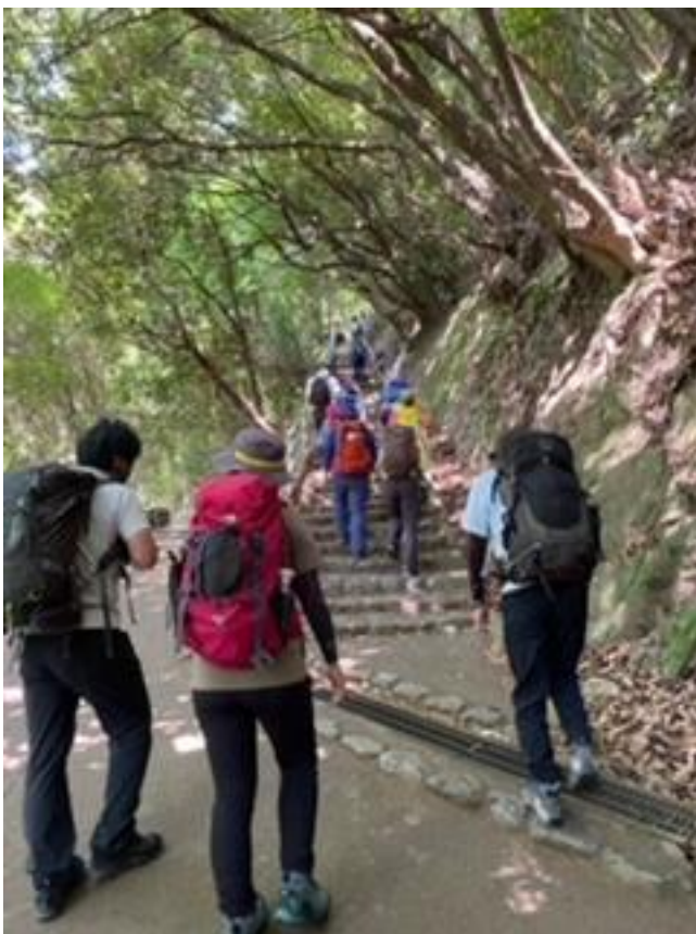
登山開始 出発です、(＊▽)ノ

途中ルートの間違えたりとハプニングはありましたが、気温の高い中 8 時間、18 kmにも及ぶ強歩トレーニングを無事に全員で下山することができた。